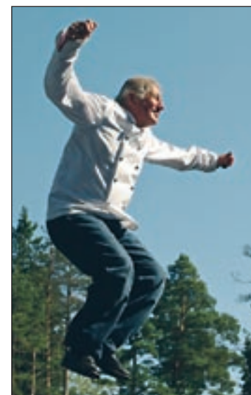
Oker-Blom: Ät rätt. Lev lätt.

I Finland har vi enligt många undersökningar världens dyraste mat. Långt ifrån importerad mat har dyra transportkostna-